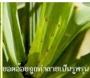
ยอดอ้อยถูกทำลายเป็นรูพรุน