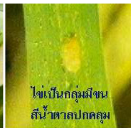
ไชเป็นกลุ่มมีขน สีน้ำตาลปกคลุม