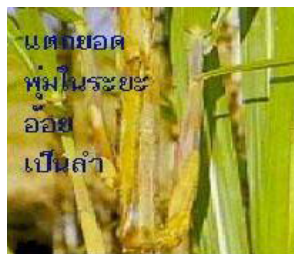
แตกยอด พุ่มในระยะ อ้อย เป็นลำ