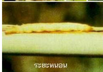
ระยะหนอน