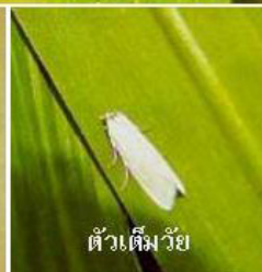
ตัวเต็มวัย